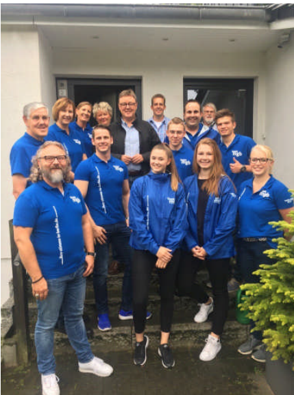
MGB, Mitglieder der CDU Seevetal und die JU sind startklar zum Hausbesuch.

(ch) Hat es bei Ihnen an der Tür auch schon geklingelt? Dann wohnen Sie möglicherweise hinter einer der über 1.000 Haustüren, die der Bundestagskandidat mit Unterstützung der Jungen Union und aus den Ortsverbänden bereits besucht hat, um auf die anstehende Bundestagswahl hinzuweisen. Bis zum Wahlsonntag am 24.09. soll noch an vielen weiteren Türen geklingelt werden.