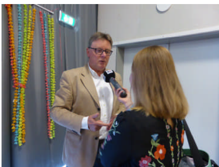
Interview mit Radio ffn am Rande der Podiumsdiskussion im Gymnasium Neu Wulmstorf

Neben einer Steuerentlastung, die gerade mittleren und geringen Einkommen zugutekommen soll, und der Unterstützung von Familien geht es in den nächsten Jahren unter anderem darum, die Staatsfinanzen auch in den kommenden Jahren zu sichern und am Schuldenstopp festzuhalten. Außerdem muss der digitale Fortschritt ermöglicht und begleitet werden - gerade in den ländlichen Regionen. Wir wollen auch am Breitbandausbau teilhaben und dürfen nicht vom Fortschritt abgeschnitten werden.