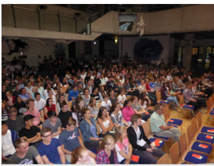
Rund 300 Schülerinnen und Schüler des Gymnasium Meckelfeld folgten der Einladung zur Podiumsdiskussion.

Egal ob in ungezwungener Atmosphäre beim Dorffest, in Diskussionen mit Erstwählern an der Schule oder bei Themennachmittagen: die Teilnehmer möchten mehr über die Arbeit des Abgeordneten in Berlin erfahren und nutzen zahlreich die Gelegenheit, sich aus erster Hand zu informieren. Außerdem interessiert natürlich die Antwort auf die Frage, welche Ziele sich MGB für die kommende Legislaturperiode gesetzt hat.