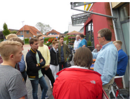
Ortsgespräch in Garstedt Insbesondere junge Menschen suchten das persönliche Gespräch mit MGB

Details und weitere Termine finden Sie auf der Internetseite ihre-stimme-in-berlin.de